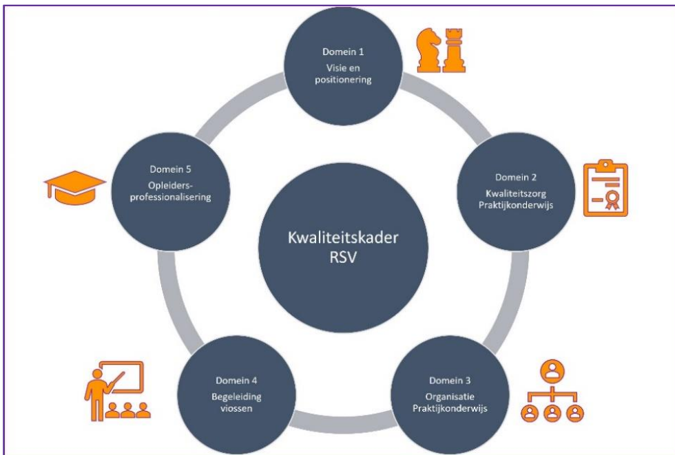
b. Visuele weergave van het Kwaliteitskader bestaande uit 5 kwaliteitsdomeinen

In het zelfevaluatie-instrument kan een praktijkinstelling bij elk van de vijf kwaliteitsdomeinen aangeven of de basis voor het praktijkonderwijs op orde is, op welke elementen zij trots zijn, waar hun ambities liggen, en of er bepaalde (kritieke) verbeterpunten zijn die zij snel willen/moeten aanpakken.